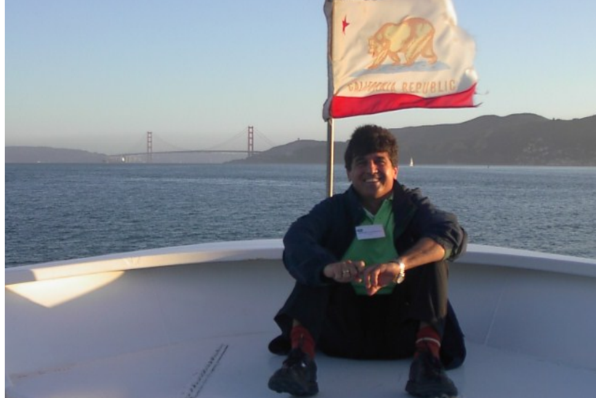
"California Cumhuriyeti bayrağının önünde San Francisco'da konferans gemi turunda- 2003"

2005 Güncelleştirilmiş ve Geliştirilmiş İkinci Baskı USA